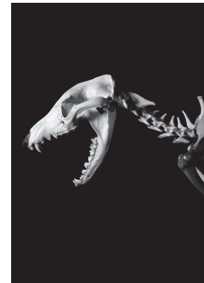
Thylacine