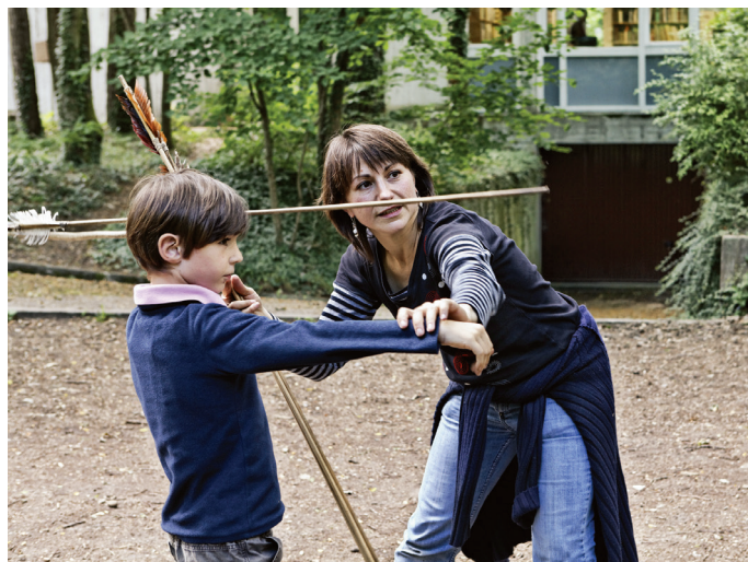
Initiation au tir au propulseur

Destinées à toute la famille, ces animations sont l'occasion d'expérimenter des objets et des gestes ancestraux mais aussi de mieux comprendre les méthodes de recherche des préhistoriens.